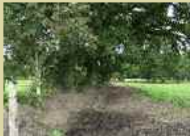
Sträucher werden in eine Pflanzrinne gesetzt – bei Weideflächen wird noch ein Zaun gezogen.