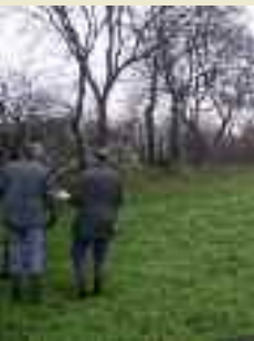
Vertreter der Bewertungskommission

In dieser Broschüre erfahren Sie genau, was gefördert wird und wie dieser Zuschuss beantragt werden kann. Alle Aspekte werden anschaulich anhand von Photos erklärt. So kann sich jeder Wallheckenbewirtschafter mit dieser Broschüre ein genaues Bild über die Fördermöglichkeiten und die damit verbundenen Verpflichtungen machen.