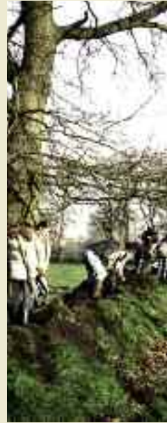
Eine Schulklasse pflanzt Sträucher – für viele Schüler ein tolles Erlebnis

Die Ostfriesische Landschaft unterstützt die Wallheckenbewirtschafteter bei der Beschaffung von Gehölzen regionaler Herkunft.