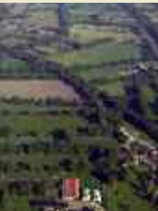
Wallhecken sind mit 5.700 km Länge wichtige Vernetzungsstrukturen für Ökologie und Tourismus

Durch den Strukturwandel in der Landwirtschaft, die Erfindung des Drahtzauns und die Einfuhr von Importhölzern verloren die Wallhecken jedoch weitgehend ihre ursprünglichen Funktionen. Daher wurde die arbeitsintensive Pflege häufig unterlassen. Dies zog den Verfall des Erdkörpers, den Rückgang der Strauchschicht und einen Verlust der Artenvielfalt nach sich. Statt der früher typischen Strauchhecken mit einzelnen Bäumen überwiegen heute Baumwälle oder baumdominierte Strauchwälle. Dies sind Verfallsstadien aufgrund einer unterbliebenen oder falschen Pflege. Untersuchungen der Wallhecken in Aurich-Oldendorf, einem für Ostfriesland typischen Wallheckengebiet, haben ergeben, dass