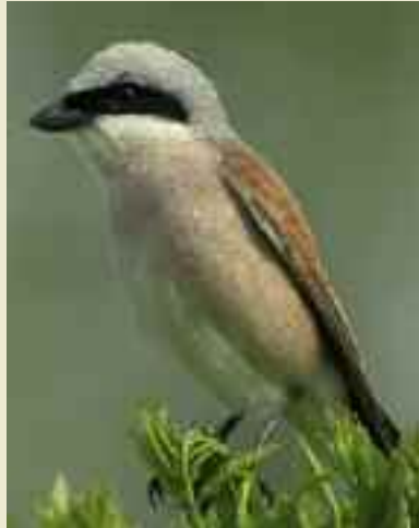
Der Neuntöter braucht dichte Heckenstrukturen; © Gerd Rossen, Fotonatur

Hecken erfüllen vielfältige Funktionen im Naturhaushalt. Sie sind Lebensraum für Flora und Fauna, bieten gleichzeitig Schutz, Deckung und Nahrung. Außerdem sind sie Orientierungshilfen, Ausichts- und Singwarten. Durch ihre vernetzte Struktur fördern sie die Ausbreitung von Pflanzen und Tieren. Strukturreiche Hecken mit einer üppigen Krautvegetation, Sträuchern, Bäu-