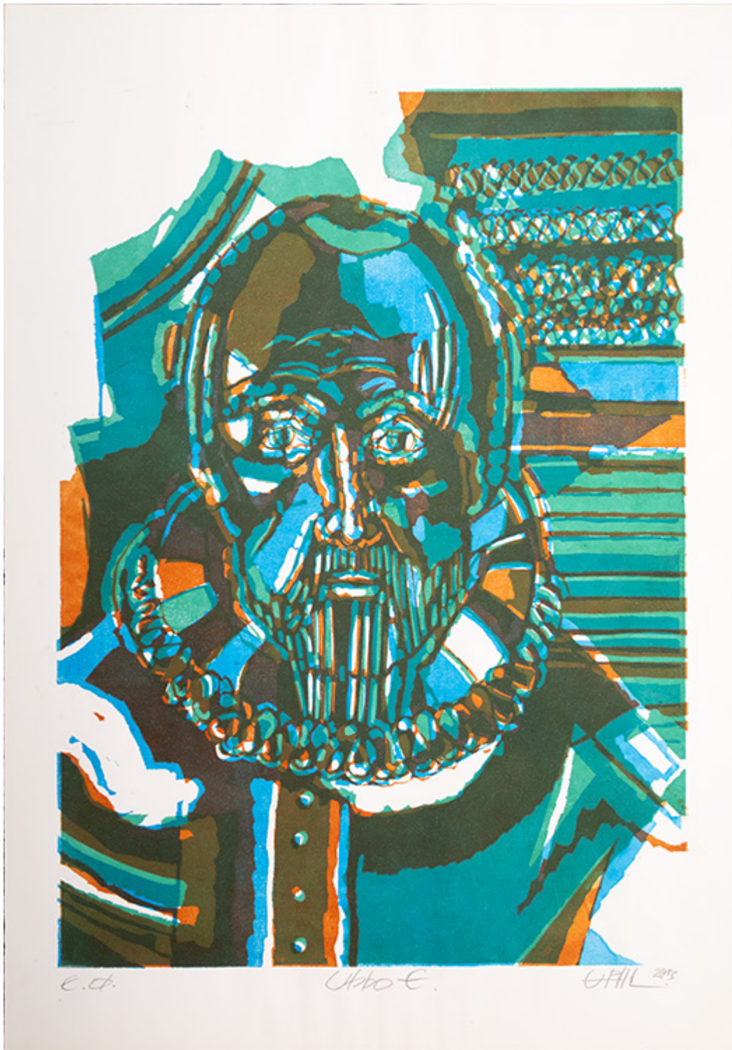
Bild des Monats der Graphothek: "Ubbo Emmius" (Uwe P. Schierholz, 2013)

„Meine Arbeiten sollen Schaulust bereiten. Ich hoffe damit auch dem Betrachter eine ganz besondere Erfahrung zu ermöglichen: die visuelle Erfahrung seiner eigenen Individualität.“ (Uwe P. Schierholz)