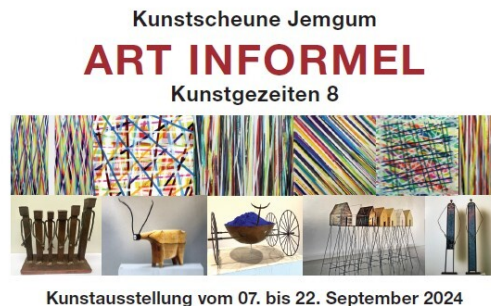
Kunstaussstellung vom 07. bis 22. September 2024

Zur Vernissage am 7. September 2024 um 18.:00 Uhr spricht Rico Mecklenburg, Präsident der Ostfriesischen Landschaft, ein Grußwort.