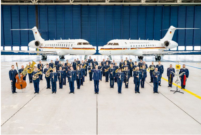
Das Luftwaffenmusikkorps Münster tritt am 24. Mai in der Stadthalle Aurich auf.