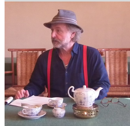
Teebotschafter Klaus-Peter Wolf