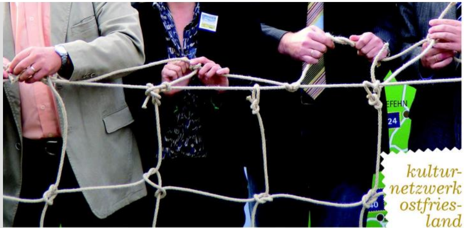
Gestaltung BeBold, Aurich

Niedersächsisches Ministerium für Wirtschaft, Arbeit, Verkehr und Digitalisierung