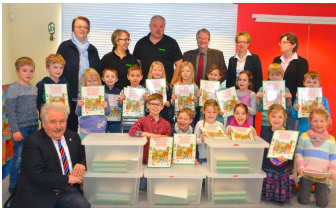
Lehrstoff, der für die Grundschüler offenbar Freude am Lesen hervorruft. Ostfriesische Landschaft und Plattdeutschbeauftragte überbrachten der Grundschule Constantia und anderen Emdener Grundschulen mehrere Klassensätze der Neuerscheinung „Mien eerste dusend Woorden“.