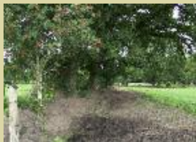
Sträucher werden in eine Pflanzrinne gesetzt; fast fertig – jetzt kommt noch der Zaun