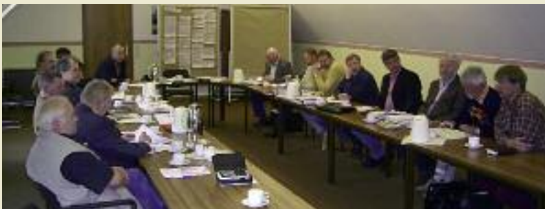
In der Kooperationsgruppe entwickelten Vertreter von Landwirtschaft und Naturschutz die Grundlagen