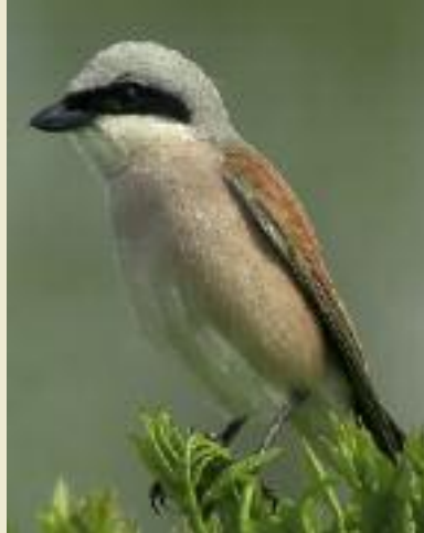
Der Neuntöter braucht dichte Heckenstrukturen

Hecken erfüllen vielfältige Funktionen im Naturhaushalt. Sie sind Lebensraum für Flora und Fauna, bieten gleichzeitig Schutz, Deckung und Nahrung. Außerdem sind sie Orientierungshilfen, Ausichts- und Singwarten. Durch ihre vernetzte Struktur fördern sie die Ausbreitung von Pflanzen und Tieren. Strukturreiche Hecken mit einer üppigen Krautvegetation, Sträuchern, Bäu-