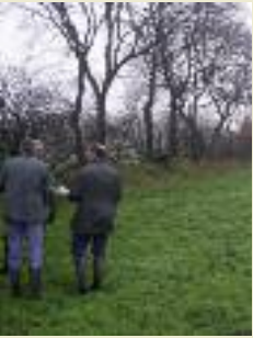
Vertreter der Bewertungskommission; © Reiner Janssen, UNB Wittmund