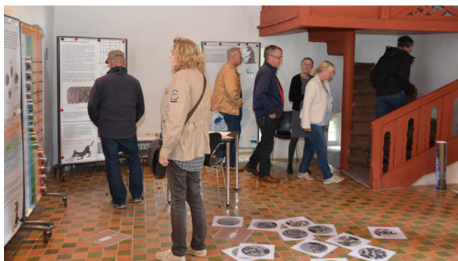
Besucher zeigten großes Interesse am Steinhaus.