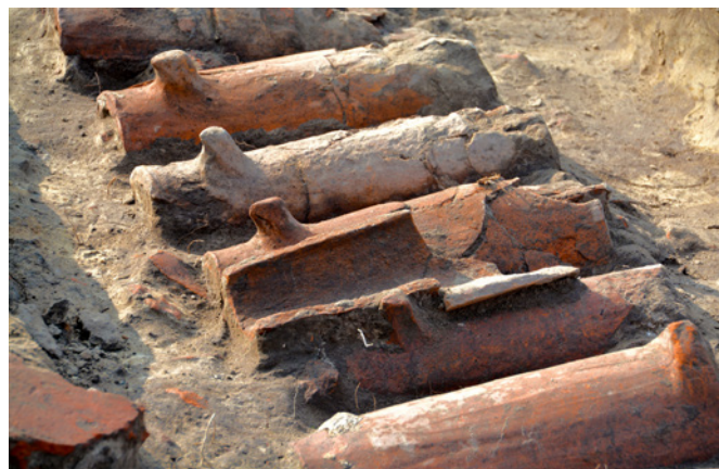
Ersten Einschätzungen zufolge könnten die Dachziegel einst auf dem Steinhaus gelegen haben.