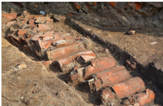
Gestapelte mittelalterliche Dachziegel in 1,50 Meter Tiefe südlich des Steinhauses.

► Die Deutsche Stiftung Denkmalschutz hat für das Forschungsprojekt 49 000 Euro zur Verfügung gestellt.