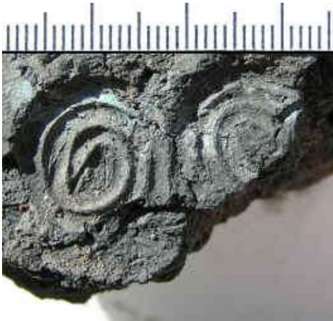
Doppelspirale von der Lehmgußform einer Glocke.