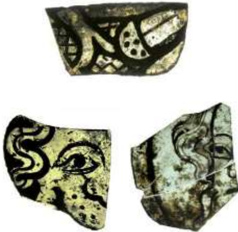
Bruchstücke von bemaltem Fensterglas aus dem ehemaligen Dominikanerkloster (Foto: R. Bärenfänger).

danach wiederhergestellt worden zu sein, u. a. fand sich kleinräumig über dem verrußten Fußboden eine Sandbettung und darauf eine neue Pflasterung. Der westliche Raum ist nach dem stratigraphischen Befund mit Bau- und Brandschutt sowie Unrat verfüllt worden. Auf diese Weise ist ein reichhaltiges Fundensemble erhalten geblieben, das wegen des sonst planmäßigen Abbruchs der ostfriesischen Klöster auf anderen Plätzen bisher nicht in solcher Fülle hervorgetreten ist: Vor allem sind diverse Bleiruten und weit mehr als 3000 Scherben von gekröseltem Fensterglas zu nennen. Etwa die Hälfte dieser Scherben trägt eine Bemalung mit Schwarzlot, wobei florale Motive überwiegen, die im Rahmen einer Grisailleverglasung wohl Rankenmuster gebildet haben (Abb. Foto). Zahlreich sind auch unterschiedlich breite Stege in den Farben gelb, rot und blau. Auch Rosetten und Kreissegmente kommen vor. Selten sind figurale Darstellungen (Abb. Foto).