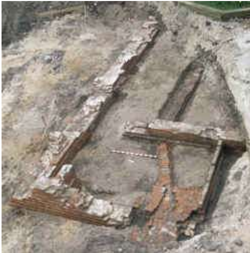
1 Blick von Nordost auf die Fundamente eines Kellers des Dominikanerklosters. Unterhalb des ehemaligen Fußbodens verlief eine aus Backsteinen verlegte Abwasserleitung.