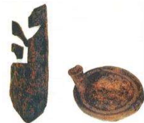
Dachschindel aus Eichenholz und zwei ineinander gestapelte Tüllengriffschalen des Spätmittelalters.

Die Kartierung dieser und anderer Fundstellen beiderseits der Grenze weist zunächst auf eine reihenförmige Anordnung der Siedlungsplätze auf dem ehemaligen Hochmoor hin. Es scheint, als hätten sich die Menschen in diesem Gebiet in mehreren Phasen vor der Ausbreitung des Dollart zurückgezogen. Eine wesentliche Rolle wird dabei die stetig zunehmende Vernässung und Senkung des Wirtschaftslandes gespielt haben, die ebenso wie die spätere Versalzung der Weideflächen zum allmählichen Rückzug zwang. Zu fragen ist nun, in welchem Zeitraum dies geschah und wann der Dollart wieder zurückwich: Die verlassenen ehemaligen Moorsiedlungen an seinem Rand hinterließ er von tonigen Ablagerungen überdeckt in einer Tiefe von heute meist mehr als einem Meter!