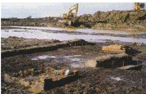
Reste des Mauerwerks während der Freilegung.

In den Zeiten vor der Eindeichung sind der Verlauf und die Gestalt der Nordseeküste ständigen Veränderungen unterworfen gewesen. Die Menschen haben auf diese Bedingungen vor allem dann reagieren müssen, wenn die Sturmflutpegel anstiegen. Archäologisch läßt sich dies für die Römische Kaiserzeit sowie für das Früh- und Hochmittelalter fassen, da die Siedlungsplätze in der Marsch zu Werten oder Warften, niederländisch terpen oder wierden , aufgehöhht worden sind. Mit der zunehmenden Eindeichung ab dem 11. Jahrhundert verlor der Bau solcher Wohnhügel an Bedeutung, nun konnte sogar niedrig liegendes Land neu erschlossen werden: Die Stoßrichtung dieser Kolonisation zielte auf das Moor!