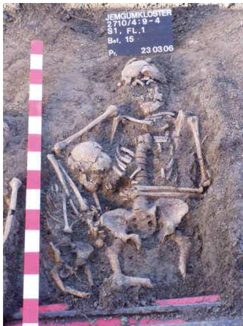
Doppelbestattung eines älteren Mannes und eines Kindes.